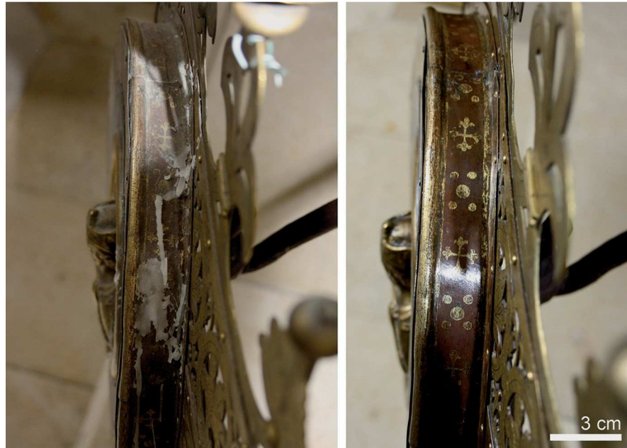
Abb. 7 Medaillonrand (Mittelstück V-VI außen), links vor und rechts nach der Reinigungsmaßnahme im Jahr 2013.

Kompresse. Dieses Zusammenspiel von Staub und Feuchtigkeit wirkt korrosionsfördernd. Daher sollte der Staub regelmäßig durch Fachpersonal abgenommen und gleichzeitig eine generelle Zustandskontrolle des Radleuchters durchgeführt werden 50 . Ebenso schädigend ist das durch die Benutzung auf das Metall tropfende Kerzenwachs.