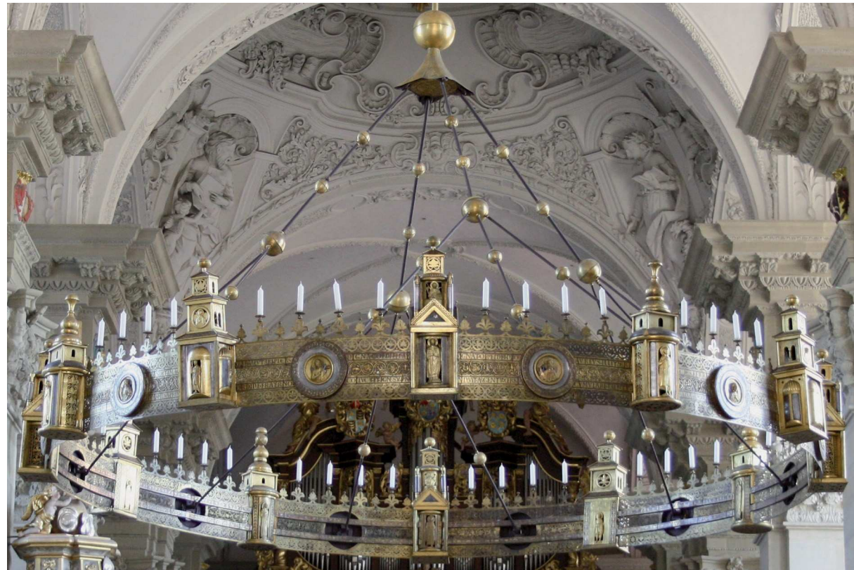
Abb. 1 Der Radleuchter in der Comburger Stiftskirche St. Nikolaus