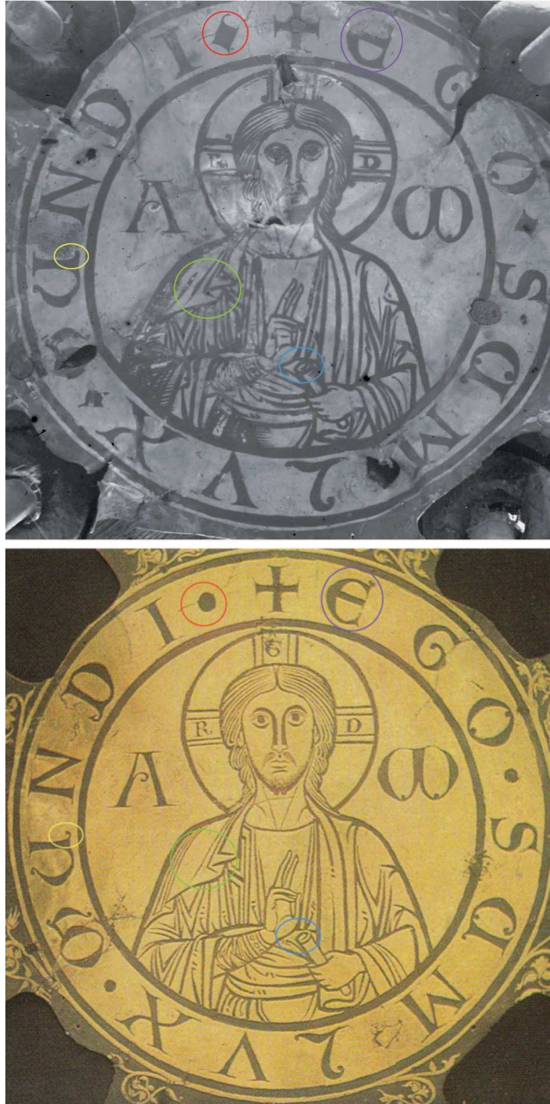
Abb. 4 Maiestas-Platte, oben vor und unten nach der Restaurierung durch die Werkstatt Amberg in den 1960er Jahren. Farblich gekennzeichnet sind Bereiche, welche starke Veränderungen im Braunfirnis zeigen.