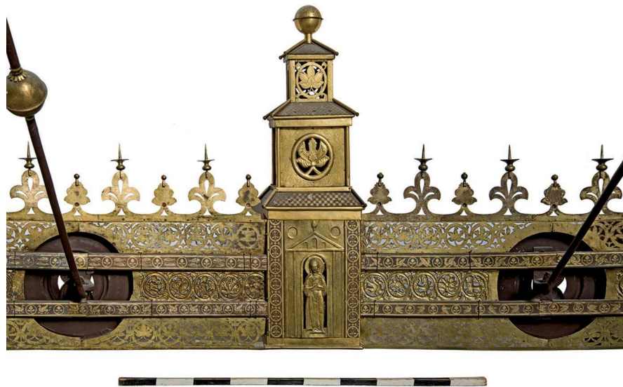
Abb. 2 Vierecktturm X Rückseite mit den Mittelstücken IX-X und X-XI

chenes Band sowie eine Bekrönung aus Lilien und Blättern. An den Spitzen der Lilien sind die gegossenen Wachsfangbecken mit den Kerzendorfen befestigt. Die mittigen Medaillons sind plastisch gestaltet und in einen vorspringenden, kreisrunden Bereich integriert. Der Randbereich wie auch der äußere Bereich weisen Verzierungen in Braunfirnisstechnik auf. Die getriebenen, jeweils von einem leicht reliefierten Silberblech 18 umgebenen Halbfiguren sind an einigen Stellen durchbrochen. Das Mittelstück besitzt hinter dem Medaillon eine Aussparung, in der sich die Verbindungspunkte der Tragegestangen und die des eisernen Reifens befinden. Die innen liegenden Eisenreifen verblenden Braunfirnisbrandstreifen mit verschiedenen Tierdarstellungen.